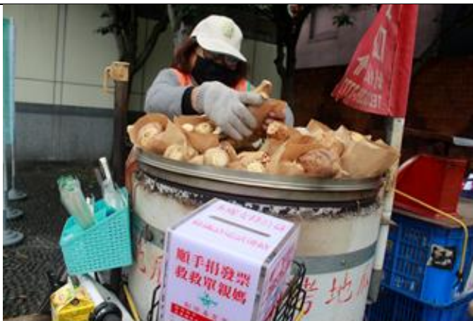
輔導單媽烤瓜服務