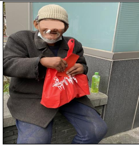
寒士吃飽 30 活動