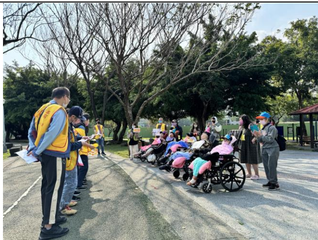
社區融合帶院民外出曬太陽