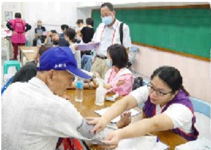
寒士防病服務-健康檢查