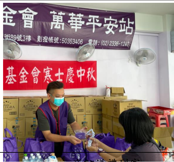
寒士三節活動-中秋