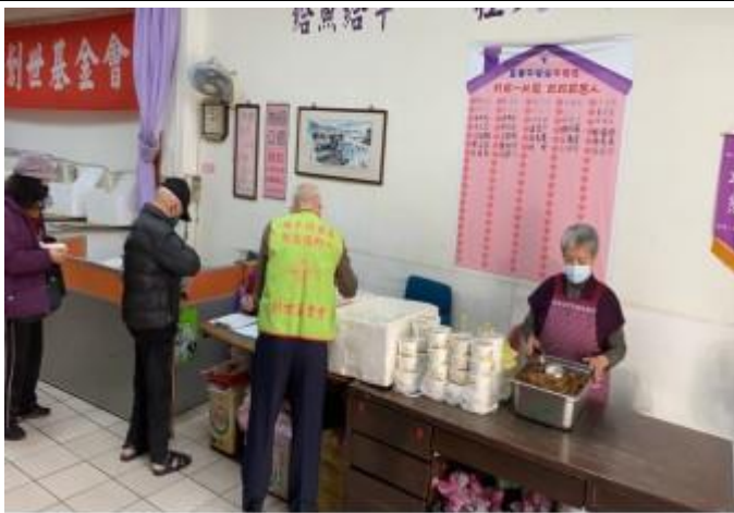
寒士防飢服務-發餐