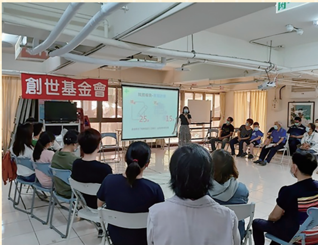
家屬參與會議凝聚共識

社工不是神，不是遇到什麼挑戰都能迎刃而解， 但期許社工夥伴們不要放棄，我們應該學習正視及善待自己的情緒， 不斷精進自己的專業，用足夠的勇氣及能量，握住那一雙雙無助的手。