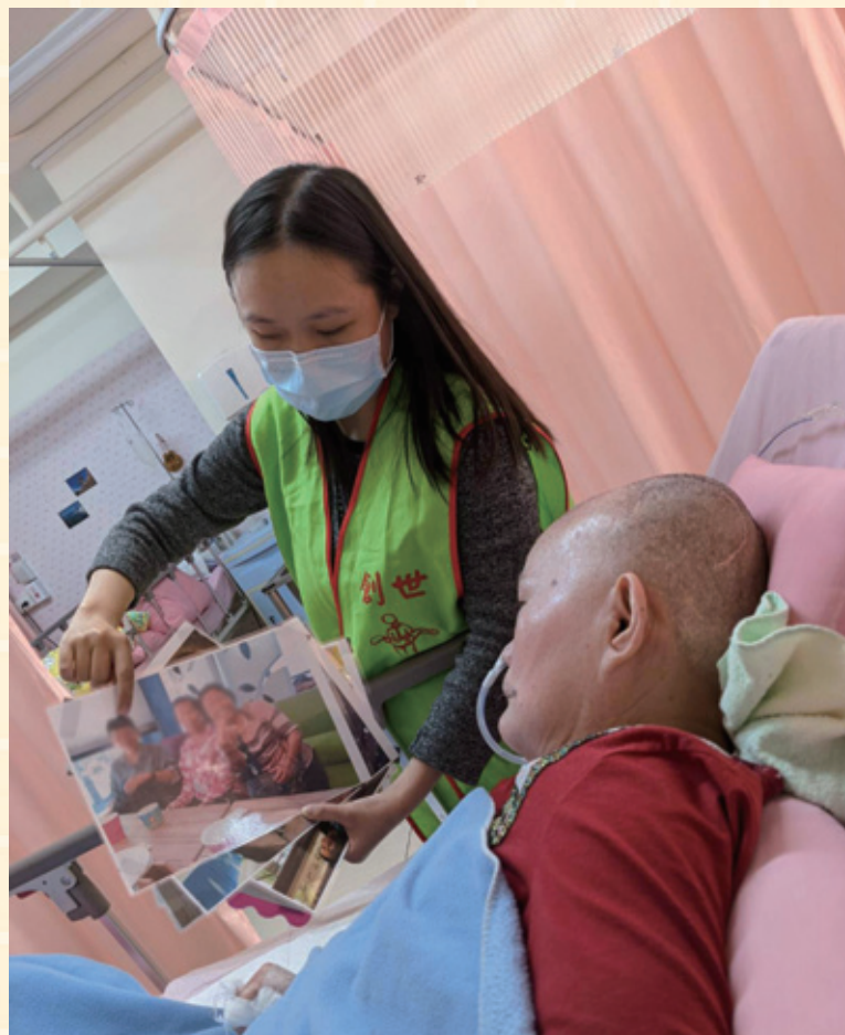
社工提供家屬照片，紓解院民思念之情。