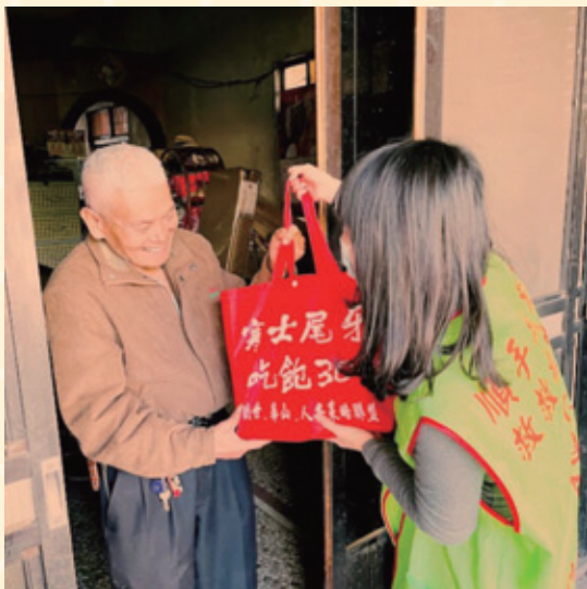
社工至安養家屬家裡致贈尾牙關懷禮

社工不是神，不是遇到什麼挑戰都能迎刃而解，有時或許是家屬拒絕服務、資源連結受阻、也或許是社會大眾過度的期待等；然而，除了外