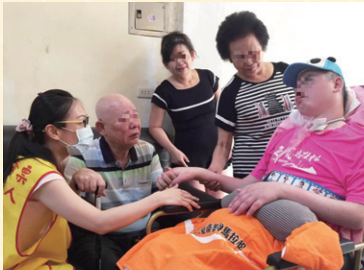
社工陪伴院民返家