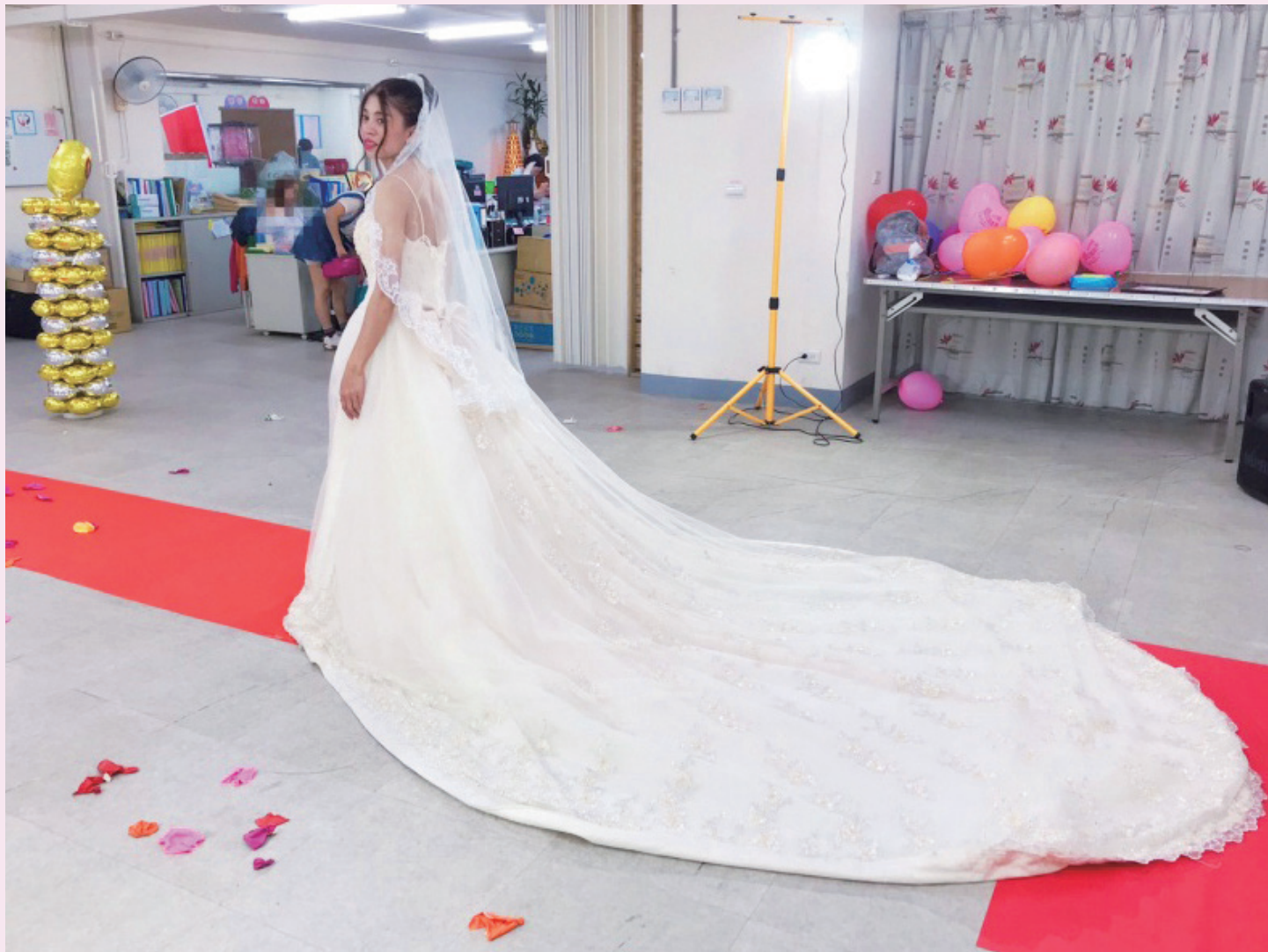
創世全體總動員，幫助院民與家人圓夢